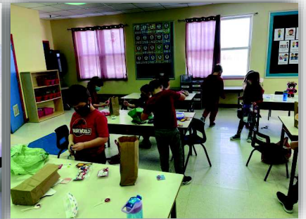
Journée Saint Valentin