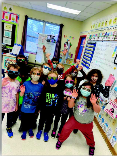
Journée lunettes à soleil